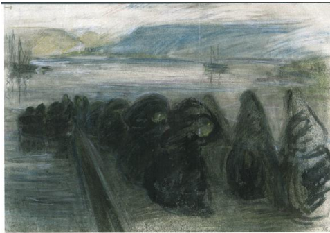
Mynd Magnús Ólafssonar af fisklæveri kvenna í Reykjavík.